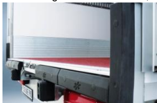
Ausführungspaket Pro : Verstärkte Puffer