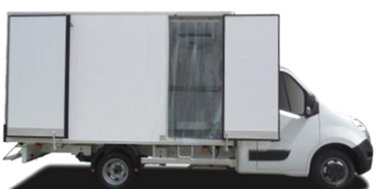
Seitentür mit Türflügel

Hecktür 1- (OB1) oder 2-flügelig (OB2), integrierte Verschlussriegel Hecköffnung mit 3 Flügeln (OT3) in den Breiten 1.91 und 2.06. Seitentür mit Flügel (900xhi) oder als Schiebetür (900x1930) Wand, verstellbare & hochklappbare Regale, Schienen, Leisten, Interinox, Hängavorrichtungen für Fleisch (bei BEEF und PRO BEEF), Ausrüstungsteile Fischhändler, Hebelklappe.