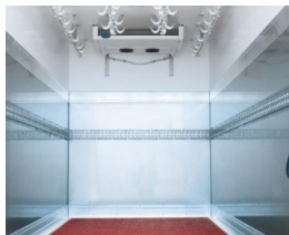
Interinox, Schienen und Hängavorrichtungen