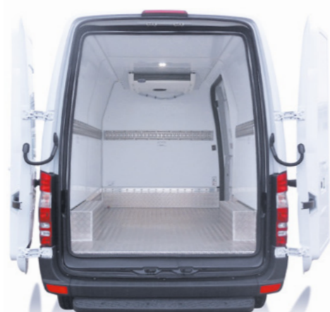
Passage de roues palettisable