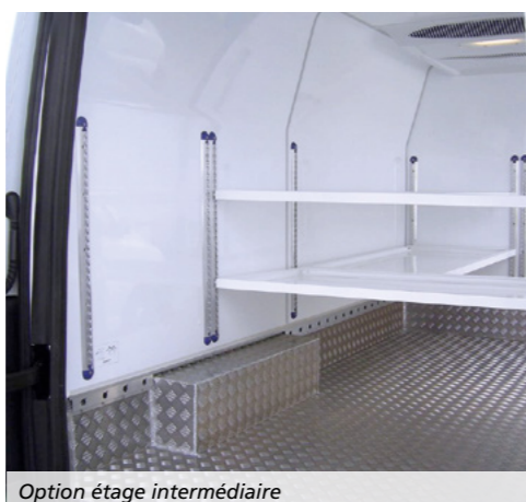
Option étage intermédiaire