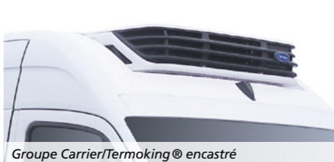
Groupe Carrier/Thermoking® encastré