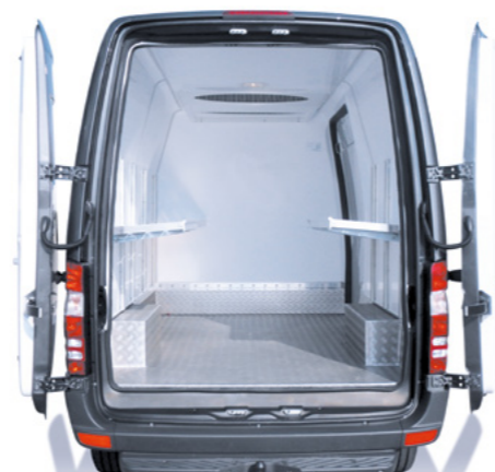
Évaporateur Kerstner intégré