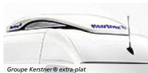
Groupe Kerstner® extra-plat