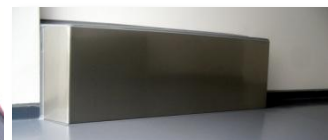
Protection inox des caissons de roues