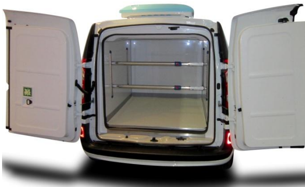
Plancher polyester (sans porte latérale)