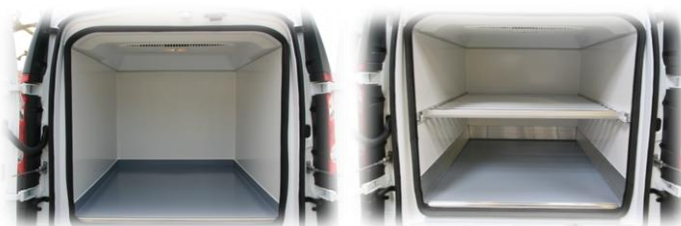
Zone de chargement cubique