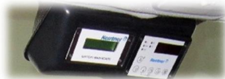
Indicateur de charge batterie et commande de groupe