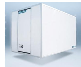
Ouverture arrière OB1 (de série).

-20 C° -18 C° -14 C° -12 C° -10 C° -8 C° -6 C° -4 C° -2 C°