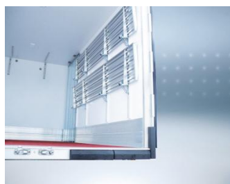
Options pack PRO et OT: montant de cadre triplé inox.

Porte lat. battante (900 x hi, position comprise entre à partir de 100 mm de l'AV). Cloison pour véhicule multi-température, étagères réglables & relevables, rails, lisses, Interinox, penderies viande (sur BEEF et PRO BEEF) équipements poissonniers.