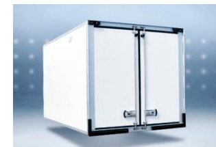
Option OT2, cadre AR boulonné (représentée: version PRO).