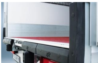
Options pack PRO et OT: Protection arrière renforcée.