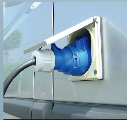
Opzione rete elettrica