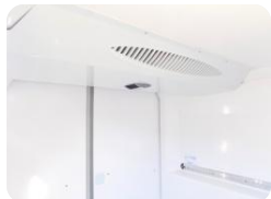
Zona de carga con evaporador