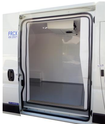
Porte latérale coulissante isolée