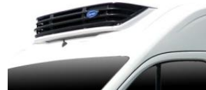
Intégration de groupe CARRIER