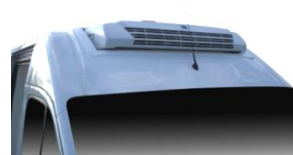
Intégration de groupe THERMOKING