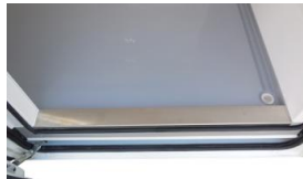
Double joint sur seuil de porte latérale