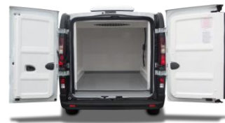
Groupe KERSTNER extra-plat avec évaporateur intégré