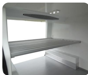
Option étage à clayettes aluminium