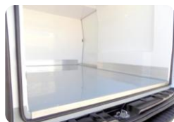
Piso con capacidad para palé y protección de las cajas de ruedas