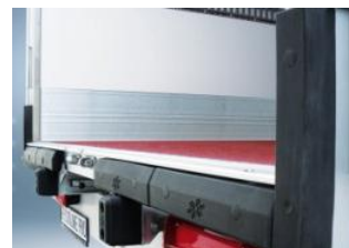
Pack Pro OT: butoirs renforcés