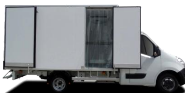
Porte latérale battante

Accès arrière 1 (OB1) ou 2 (OB2) battants, crémones intégrées. Ouverture AR totale 3 vantaux (OT3) sur cadre renforcé boulonné. Porte latérale battante (900xhi) ou coulissante (900x1930). Cloison, étagères réglables & relevables, rails, lisses, Interinox, penderies viande (sur BEEF et PRO BEEF), équipements poissonniers, hayon élévateur.