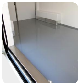
Protection des passages de roue et seuils