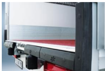
Pack PRO & OT: protection de cadre arrière renforcée (jusqu'à 6 butoirs).