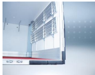
Options pack PRO et OT: montant de cadre triplé inox.