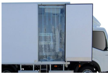
Option porte latérale + rideaux anti-déperdition.