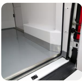
Protection des passages de roue et seuils