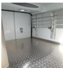
Plancher aluminium (L2H1)