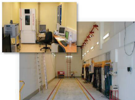
Tunnel CEMAFROID pour test et définition du coefficient d'isothermie "K" d'un véhicule type.