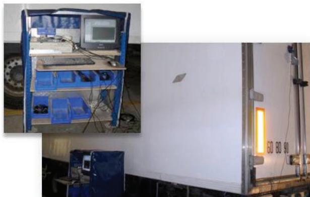
Test de descente en température pour renouvellement d'agrément (6 ans, 9 ans).