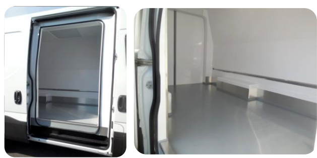
Porte latérale coulissante isolée avec double joint périphérique