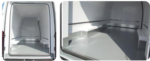
Plancher palettisable (monte simple) et protection de caisson de roue de série