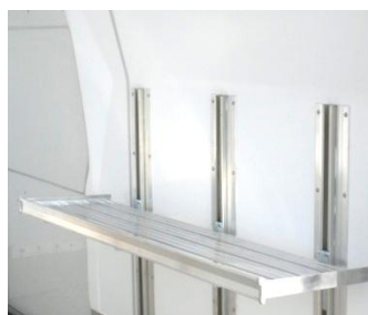
Option étagères réglables et relevables.