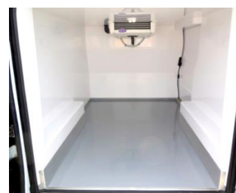
Protection inox passage de roues.

Document non contractuel. Visuels pouvant présenter des équipements optionnels. Dans le cadre de sa politique d'améliorations continues, LAMBERET se réserve le droit de modifier les caractéristiques des transformations sans préavis.