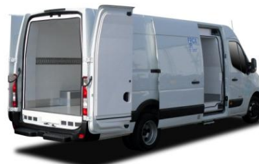
Version propulsion L4