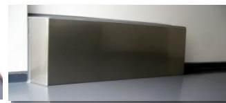
Protection inox des caissons de roues