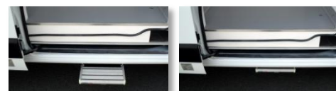
Marche latérale rétractable Quickstep (uniquement associée à la porte latérale - série en version propulsion)