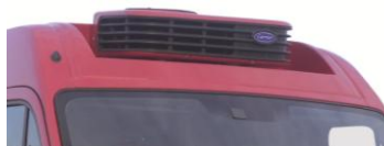
Groupe encastré + option peinture