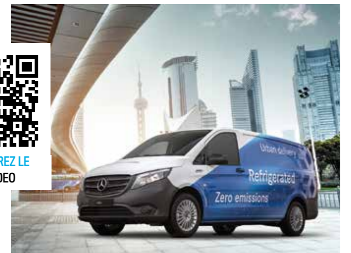
Le groupe frigorifique e-CoolJet 106 est logé à l'emplacement de la roue de secours pour préserver la hauteur hors-tout et l'aérodynamique.