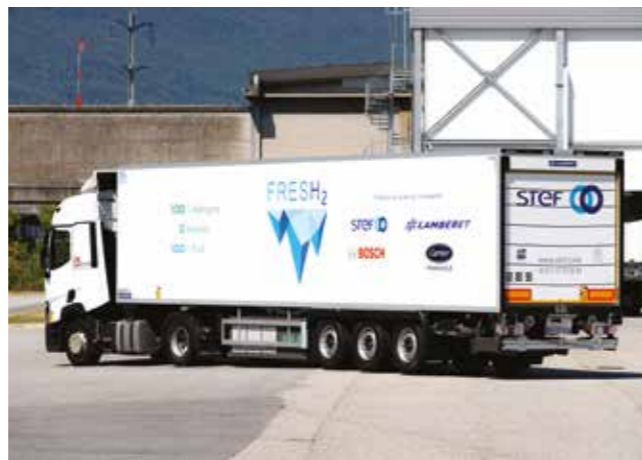
Les essais en conditions réelles avec le transporteur STEF sont concluants: la technologie de PAC H2 directe BOSCH a permis d'assurer dans la durée des tournées de distribution en multi-température.