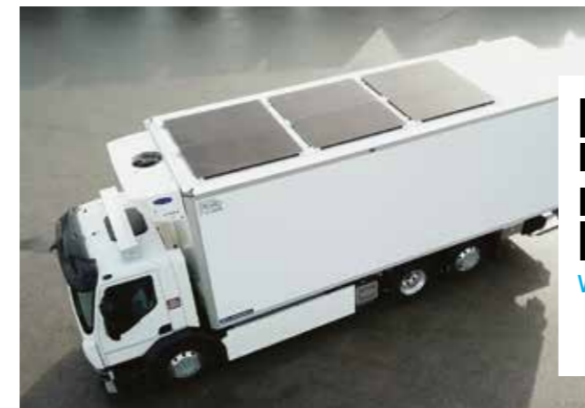
Lamberet a équipé le toit de la carrosserie de 6 panneaux solaires, soit une surface de 10 m 2 pour une puissance de 2 400 W en crête.

Les 1 er porteurs frigorifiques 100% électriques RENAULT TRUCKS D-Wide ZE 26 tonnes de série ont été carrossés par Lamberet. Ils offrent 150 km d'autonomie, une caisse Frigoline HD isotherme renforcée, un groupe froid silencieux et ici des panneaux solaires en appont pour alimenter le groupe frigorifique électrique, le hayon élévateur, la recharge transpalette et l'éclairage, en minimisant l'impact sur l'autonomie de traction. Cette solution est LA réponse à la livraison urbaine responsable : Zéro émission gazeuse, Zéro émission sonore.