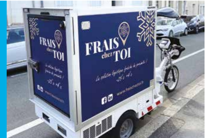
KLEUSTER Freegone s'équipe de la nouvelle cellule Frigoline coefficient K 0.31 et d'un groupe frigorifique en froid positif, plug & play.

Le nouveau KLEUSTER Freegone Frigoline et ses 1,5 m 3 réfrigérés est un vélo cargo à assistance électrique. Zéro émission, Zéro bruit et Zéro encombrement aussi car il peut emprunter les pistes cyclables. Son groupe frigorifique et sa caisse bénéficient d'une homologation ATP. Sa nouvelle cellule Frigoline offre une large ouverture arrière innovante 'OT1'. Sa traction électrique le propulse jusqu'à 18 km/h sans effort, comprend une aide au démarrage en côte, une fonction régulateur de vitesse et se recharge en 5 heures sur une simple prise 230V 16 ampères. LE tricycle électrique idéal pour assurer les livraisons urbaines !